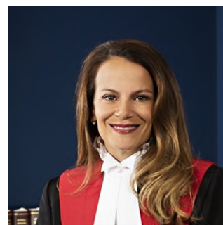
Honorable Anne Loparco

Sous le thème « Des grands lacs aux Rocheuses – Solidaires pour un meilleur accès à la justice en français » l'évènement sera sous la coprésidence des honorables juges Anna Loparco (Cour du Banc du Roi de l'Alberta) et Lise Maisonneuve (Cour de justice de l'Ontario). Le congrès accueillera également les dignitaires Raymond Théberge, Commissaire aux langues officielles du Canada et l'honorable René Cormier du Sénat du Canada. Des juristes chevronnés et d'autres experts animeront sept panels juridiques en droit pénal, administratif, ainsi qu'en droits linguistiques et autochtones.